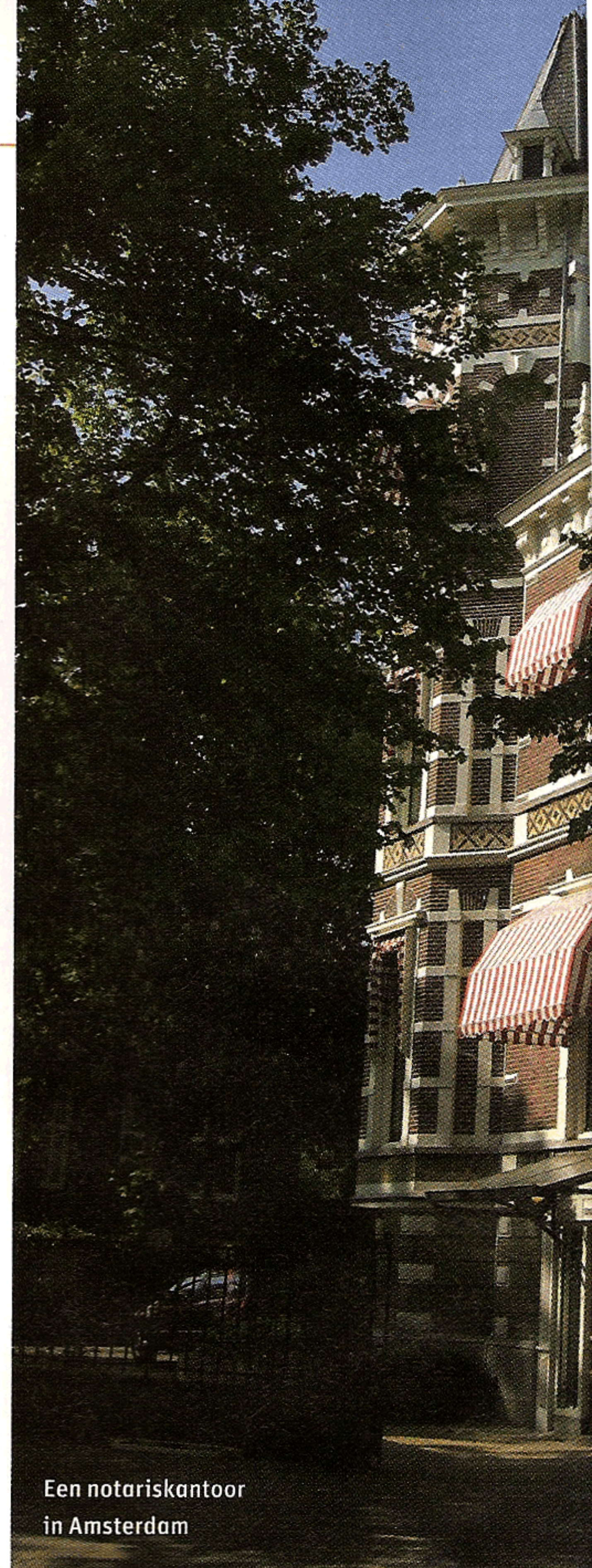
Een notariskantoor in Amsterdam